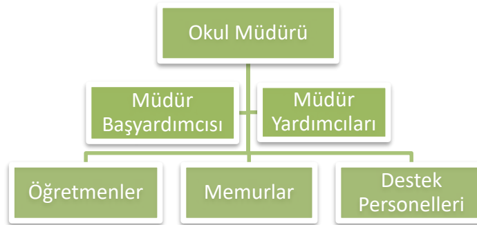
Şekil 2: Şarkikaraağaç MTAL Organizasyon Şeması

Şarkikaraağaç Mesleki ve Teknik Anadolu Lisesi Müdürlüğü bir müdür, bir müdür başyardımcısı, dört müdür yardımcısı, kırk iki öğretmen, iki memur, bir teknisyen, altı kadrolu işçi, üç hizmetli bulunmaktadır.