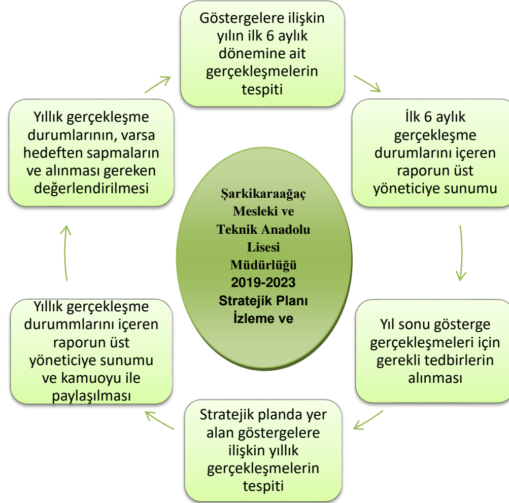
Şekil 3: Şarkikaraağaç Mesleki ve Teknik Anadolu Lisesi Müdürlüğü İzleme Ve Değerlendirme Modeli