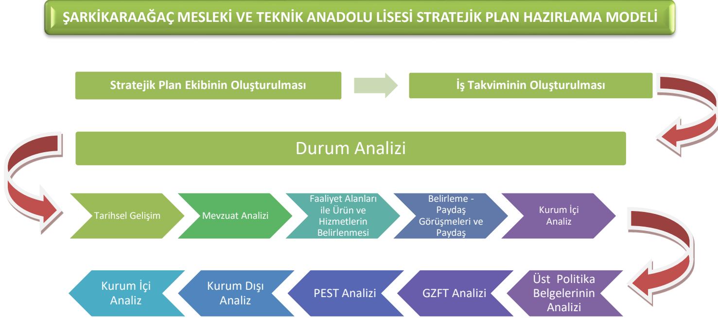
Şekil 1. Stratejik Planlama Süreci Şeması